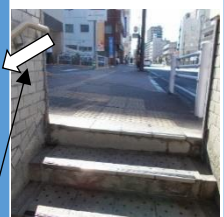
写真⑦:出口としての状況