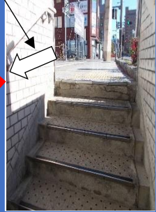
写真⑤:出口としての状況