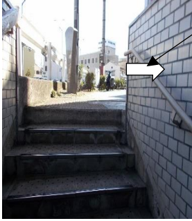
写真①:出口としての状況