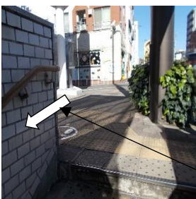
写真③:出口としての状況