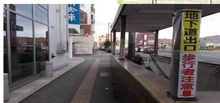
(南側から北側向け表示の状況)