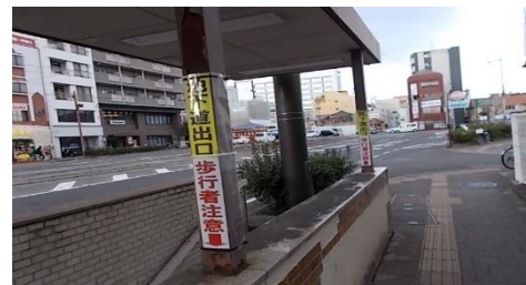
(南側から北側向け表示の状況)