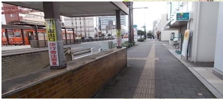
(北側から南側向け表示の状況)

登下校時とも通行自転車、通学中の高校生等と経路が重なる。地下道出口付近は、地下道から出てくる児童が見えにくい上、狭路のため、児童と接触の危険性がある。