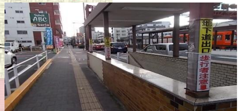
(北側から南側向け表示の状況)

登下校時とも通勤自転車、通学中の高校生等と経路が重なる。特に下校時は、スーパーに出入りする車やバイク、自転車下校中の高校生等で混雑し、児童らの直近を通行するため、接触の危険性がある。