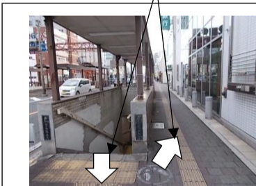
(きたがわでいりぐち)