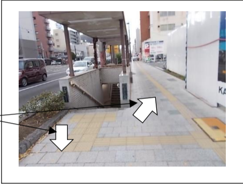
じてんしゃにちゅういしよう