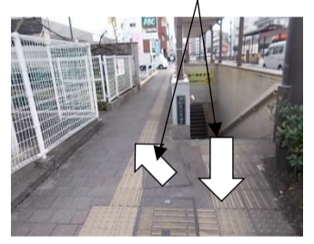
(きたがわでいりぐち)