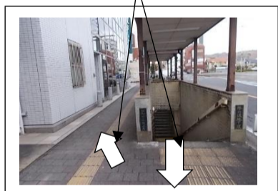
(みなみがわでいりぐち)